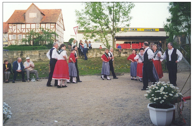
Volkstanzgruppe des TSV 1912 Wollrode