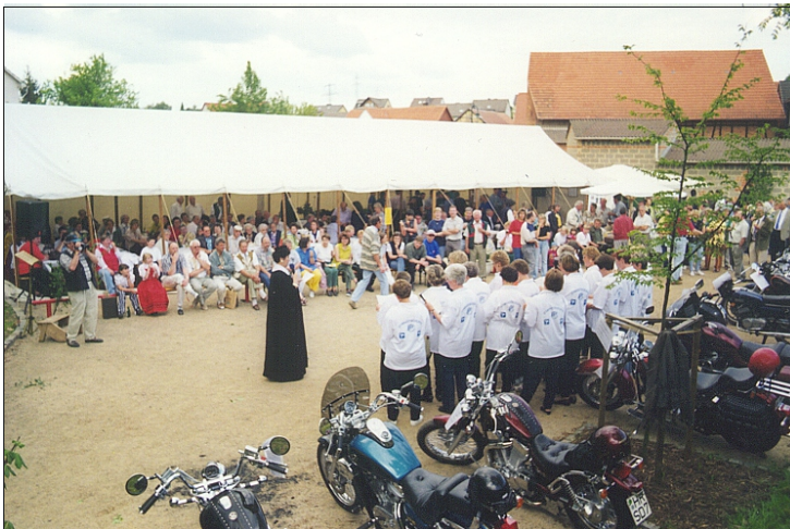
Gymnastikabteilung des TSV 1912 Wollrode