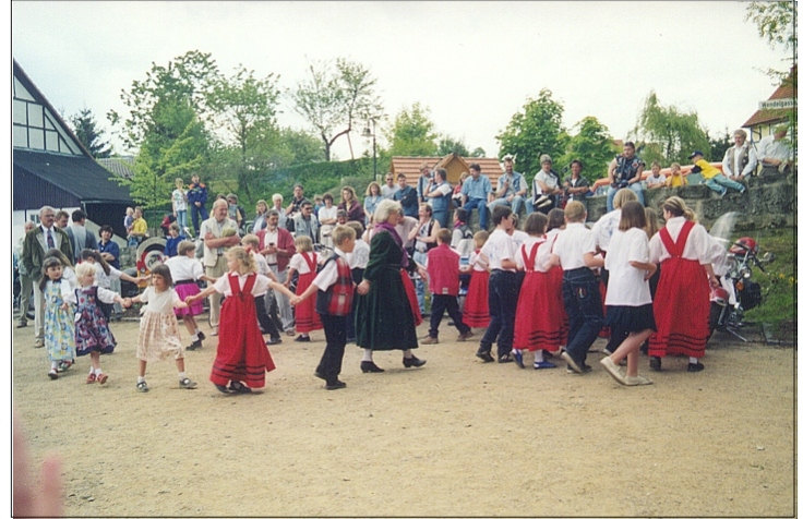
Kindervolkstanzgruppe des TSV 1912 Wollrode