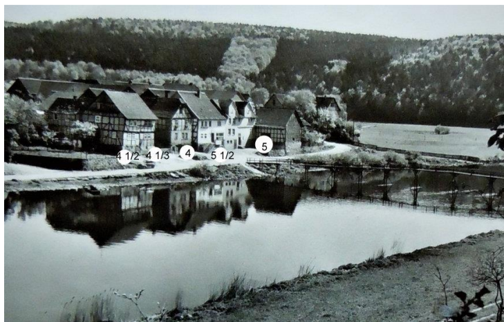
Nr. 4 1/2 Heinrich Griesel, Nr. 4 3/4 Heinrich Köbberling. Nr. 4 Konrad Ebert Nr. 5 1/2 Otto Jäger, Nr. 5 Valentin Ebert