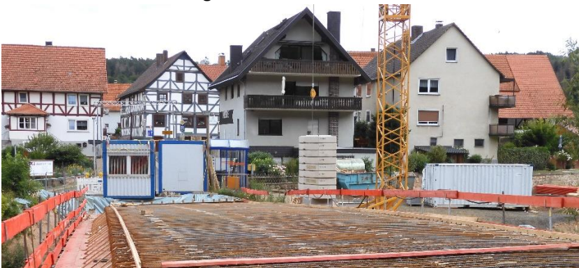
Nr. 8 Ralf Hartung Wohnhaus & Metzgerladen gebaut 1983