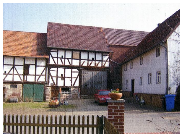
2004 Hof Adolf Eber