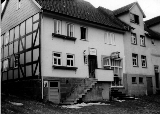
Gasthaus Karl Hardung 1955