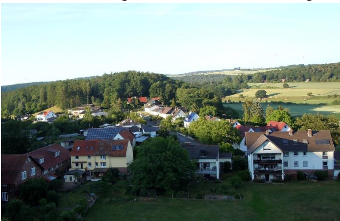
Haus Grebe & Eberth Neu-Umbau 1979