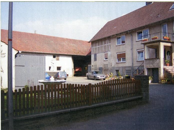
2004 Hof Bern Reuße