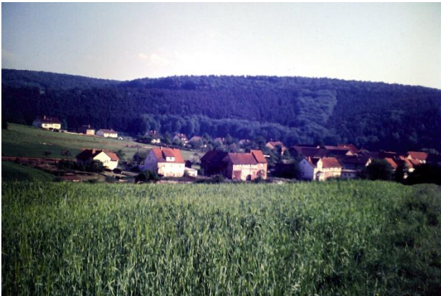
Haus Köbberling 1965, Justus Ebert, Wicke 1969