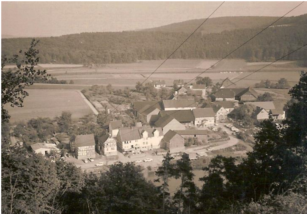
1965 von der Fischerstube bis zum Parkplatz Hartung