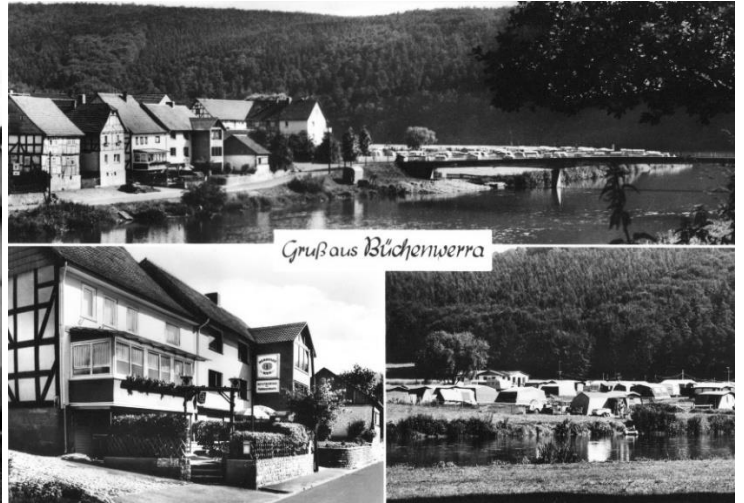
Nr. 9 Campingplatz Marga & Peter Reiß 1969