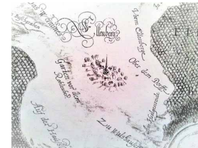
Ellenberg (Zeichnung Dilich 1615)

Wenn Sie nun den Grasweg entlang in Richtung Büchenwerra wandern, gelangen Sie, vorbei an einem modernen Kuhstall, zur nächsten Station 13, dem Malerwinkel .