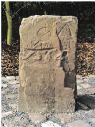
Der Markerstein am jetzigen Standort