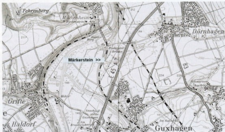
Topographische Karte Kassel 1:50 000 : Ausschnitt mit Lagekennzeichnung

TK 4722 Kassel-Niederzwehren, Rechtswert 32980, Hochwert 76260 (entspricht nach GPS WGS 84: N 51°13,221' - E 009°28,259')