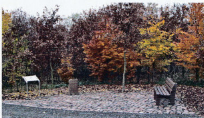
Der jetzige Standort des Flurdenkmals mit Ruhebank und Informationstafel (November 2010)