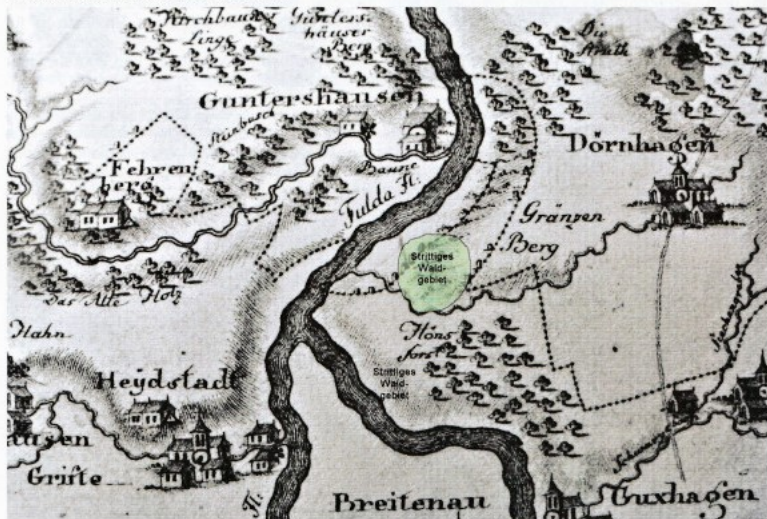
Bearbeiteter Ausschnitt einer späteren Karte mit dem umstrittenen Gebiet (nach Schleenstein - ca. 1710 )

Man braucht nicht viel Phantasie um sich auszumalen, dass diese Konstellation nahezu zwangsläufig Konflikte mit sich brachte: Wer durfte an welcher Stelle Holz schlagen und nach Hause holen? Wie weit durfte der Dorfhirte mit seinen Tieren in den Wald vordringen? Solche und ähnliche Fragen gehörten zum Alltag. Die Dokumente belegen, dass Grenzverletzungen und Holzfrevel im Casselbusch jahrelang an der Tagesordnung waren. Das fand Ausdruck in gegenseitigen Beschuldigungen und zahlreichen Beschwerdebriefen 6 , die von schreibkundigen Personen im Namen der jeweiligen Partei verfasst wurden.