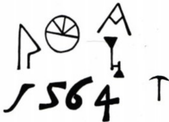
Jahreszahl mit den Symbolen

Auf die Bedeutung der Jahreszahl und deren ortshistorische Einbettung wird weiter unten eingegangen.