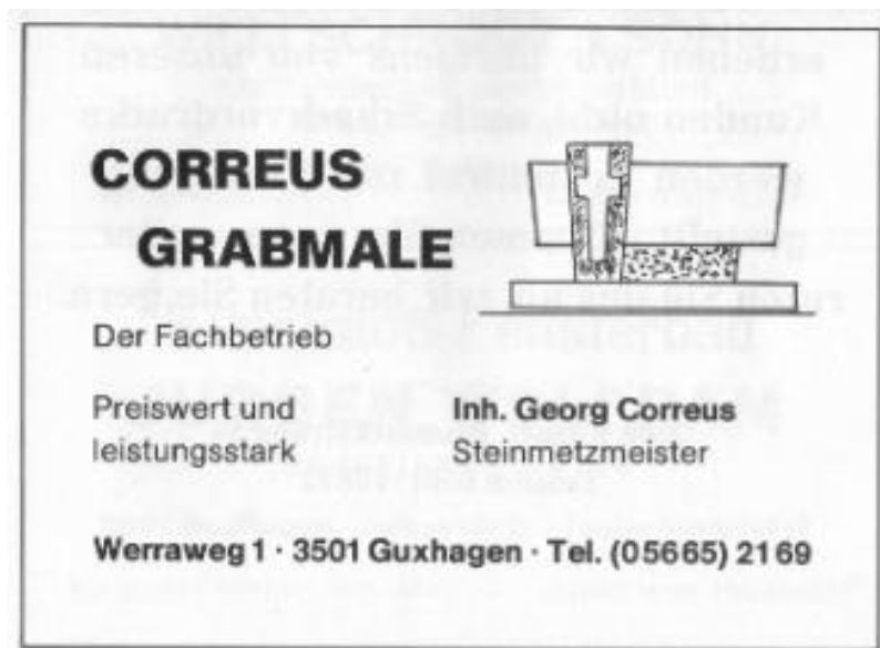
Anzeige von 1977