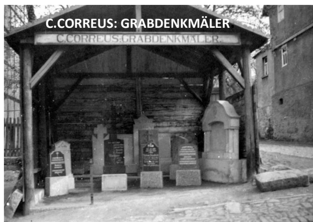
Werkstatt Sellestraße 1934