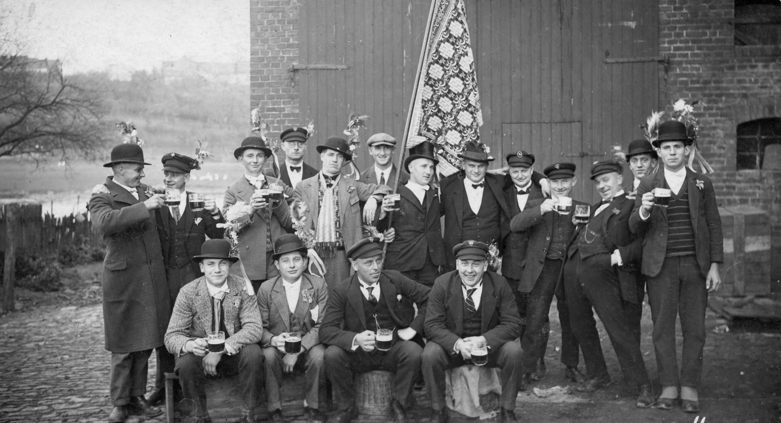
„Ach wenn doch immer Kirmes wär.“ Cuxhagen 1929.