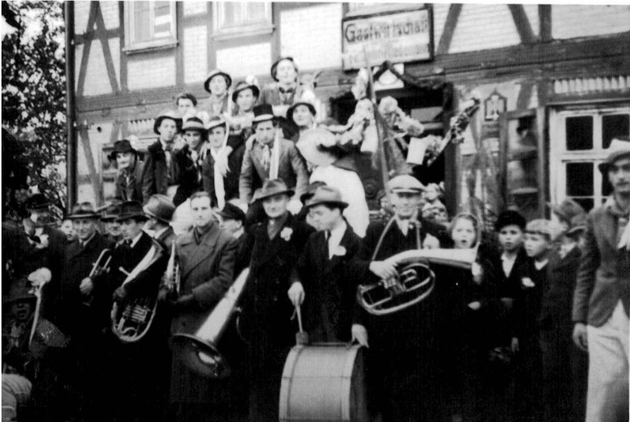
Vor Gasthaus Riedemann