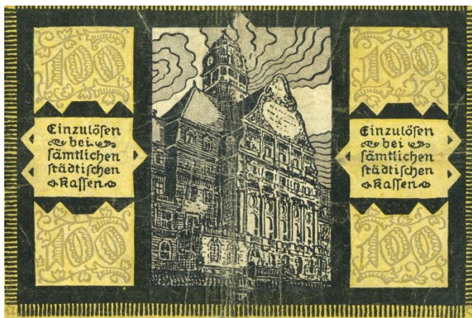
Das waren noch Gutscheine