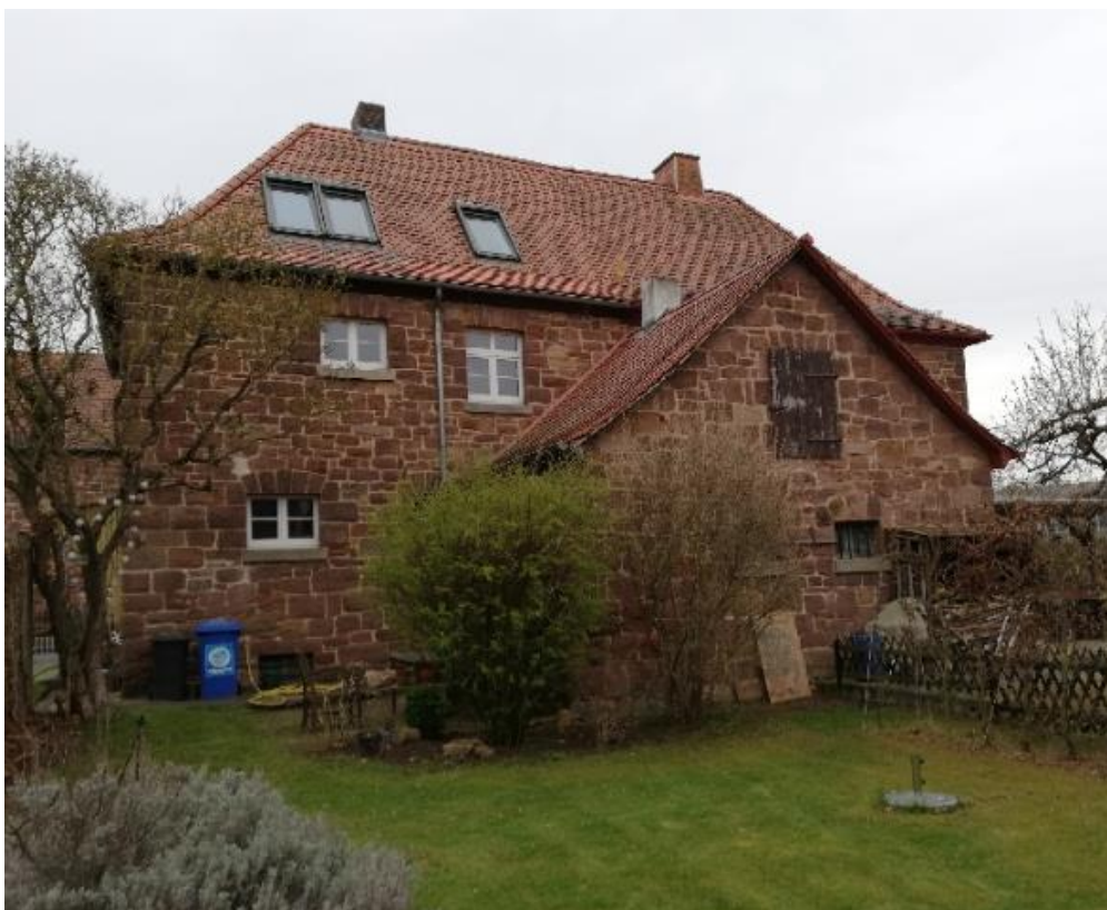
Bilder von 2021