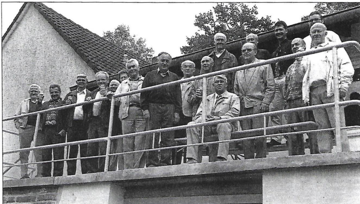
Ein Prosit auf die getane Arbeit: Voller Stolz stehen die Alten Herren des TSV 07 Ellenberg auf der neuen Terrasse des Sporthauses, das sie maßgeblich mit erweiterter und umbauten.