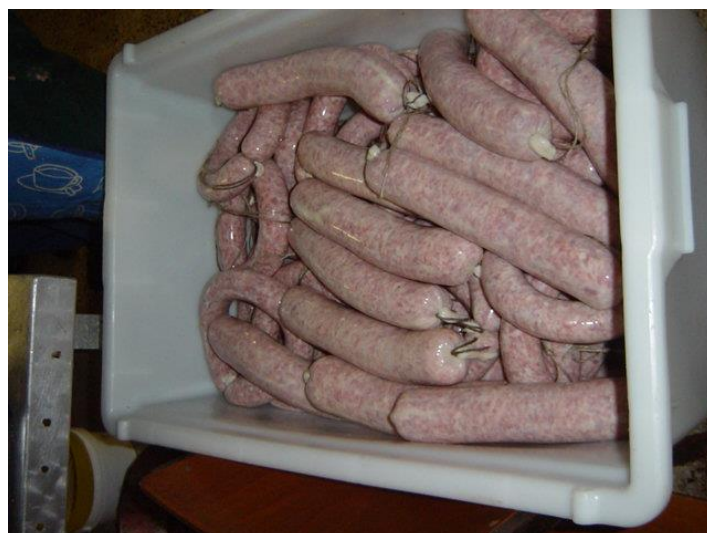
Die „ GUTE ALTE WURST „