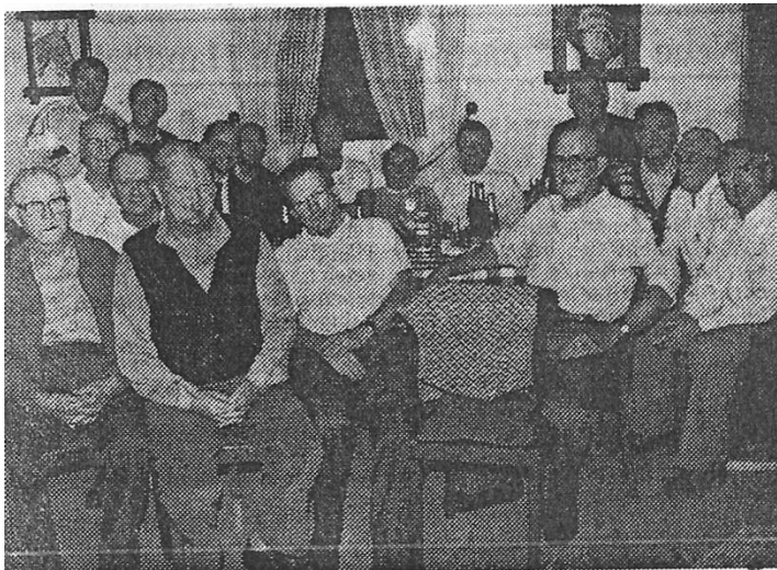
DIE SUPERALTHERREN des TSV Ellenberg beim wöchentlichen Treff in ihrem Heim.

„Superaltherren“ verschworene Gemeinschaft