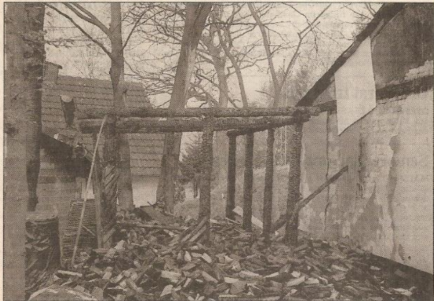
Vom Holzschuppen aus griff das Feuer auf das alte Vereinsheim über. Das neue Gebäude, massiv aus Steinen gemauert, blieb verschont.

Die verhinderten durch Kühlen und Löschen, daß der Tank zu heiß wurde und daß sich der Brand weiter ausbreiten konnte.