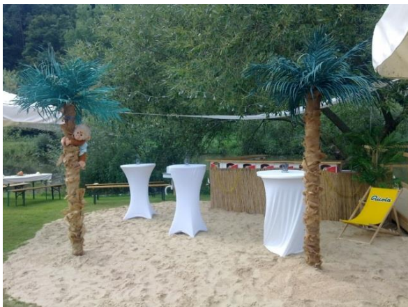
An der Strandbar