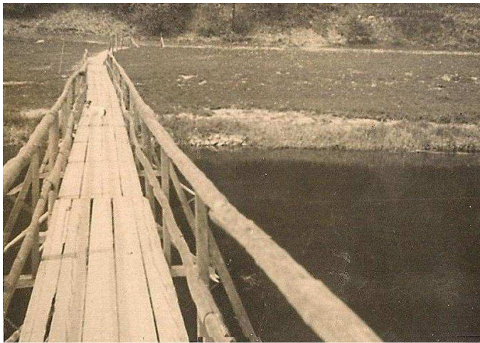
Auf der Specke steht ein Hund!