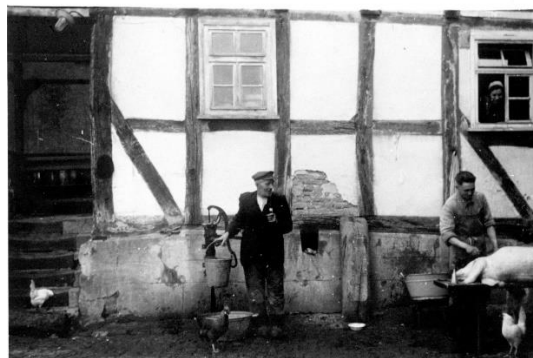
Blick von der Specke auf den Hof von Heinrich Ebert (Fisch Ebert) beim schlachten