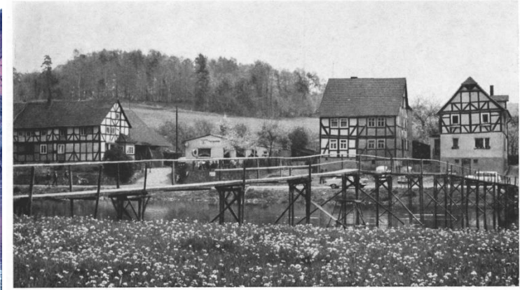
„ZUR FISCHERSTUBE“ H. EBERT-BUCHENWERRA · Ruf Guxhagen 266