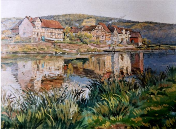
Bilder ca. 1955